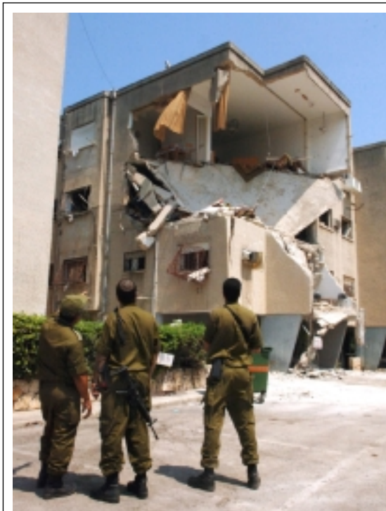
«Wir müssen den von den Katjuschas der Hisbollah getroffenen Norden und die Siedlungen im westlichen Negev, wo die Kassamraketen der Hamas einschlugen, wieder aufbauen.»

Ich glaube nicht, dass Syrien ein ernsthaftes Problem für uns darstellt, die Hisbollah übrigens auch nicht. Die Gefahrenquelle befindet sich in Iran, denn die Vernichtung Israels stellt hier nur einen ersten Schritt zur Zerstörung des Westens dar. Die westlichen Län-