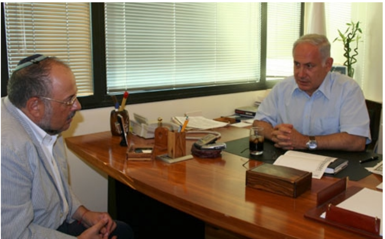
Benjamin Netanjahu, der ehemalige (und vielleicht zukünftige) Premierminister des Staates Israel, gegenwärtig Chef der parlamentarischen Opposition, empfing den Chefredakteur von SHALOM zu einem exklusiven Gespräch über die allgemeine Lage.