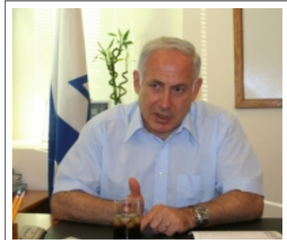
«Die Israelis sind aus ihren Illusionen erwacht und haben sehr wohl verstanden, dass bei diesem Konflikt nicht die territoriale Frage auf dem Spiel steht, sondern die eigentliche Existenz des jüdischen Staates.»

der müssen unbedingt Allianzen eingehen, um sich gegen Iran zu wehren. Ich behaupte sogar, dass auch die USA ungeachtet ihrer Macht Alliierte brauchen und dass die Europäer, obwohl einige Länder dieses Kontinents es noch nicht begriffen haben, gezwungen sind Bündnisse mit jenen einzugehen, die dieselben Werte vertreten. Deshalb poche ich so hartnäckig auf die Tatsache, dass Israel in jeder Hinsicht stark sein muss, da niemand sich mit einem schwachen Partner zusammenschließen will. Es ist unsere Pflicht, nicht nur wirklich stark zu sein, sondern auch das Bild von Stärke zu vermitteln.