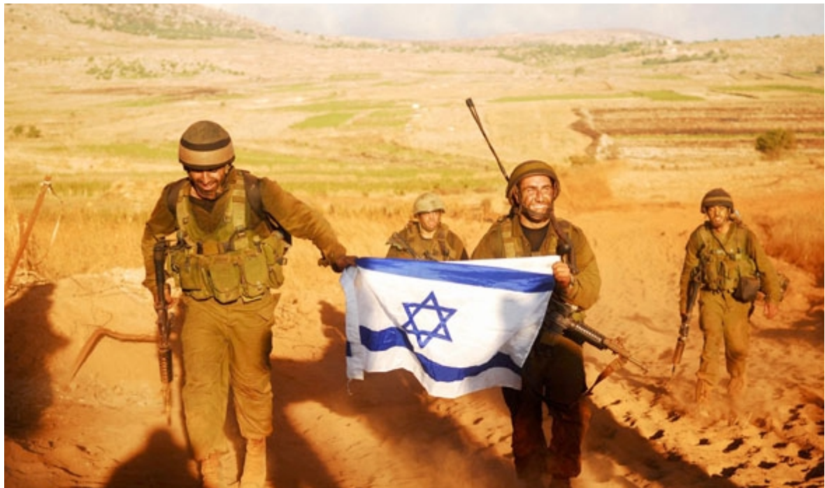
«Die Bevölkerung und die Soldaten haben aussergewöhnlichen Mut, Kampfgeist, Entschlossenheit und Opferbereitschaft gezeigt.»

in Mitleidenschaft gezogen, dass Syrien sich der Illusion hingibt, den Golan mit Gewalt wieder einnehmen zu können; dass Iran offen von unserer vollständigen Vernichtung spricht und dass die Hisbollah und der Hamas behaupten, die Juden seien Feiglinge, die mit reiner Willenskraft der militanten islamischen Welt eliminiert werden können. Heute stellt sich demnach nicht die Frage, ob wir im Rahmen eventueller Verhandlungen zu Konzessionen bereit sind, sondern wie wir unsere Politik der Schwäche in eine Politik der Stärke und der Abschreckung verwandeln. Wir werden nicht auf der Grundlage von unterzeichneten Vereinbarungen überleben, die kaum das Papier wert sind, auf dem sie stehen. Wir können uns nur mit Hilfe unserer militärischen, politischen, wirtschaftlichen, kulturellen und geistigen Stärke erfolgreich durchsetzen, die unserem Glauben als jüdischer Staat basiert. Wir müssen die Welt daran erinnern, warum wir hier sind und nicht anderswo und welches unsere historischen Beziehungen als Nation zu diesem Land sind, untermauert durch das Fundament unseres Glaubens und die von uns verteidigten moralischen Werte der Juden. Die Welt im Allgemeinen und unsere Nachbarn im Besonderen müssen begreifen und akzeptieren, dass wir bereit sind, für das Recht der Juden auf ein Leben hier zu kämpfen. Leider zählt in Bezug auf die Abschreckung nicht die Art, wie wir uns selbst wahrnehmen, wie wir fühlen und die Dinge sehen, sondern die Art, wie wir von unseren Feinden wahrgenommen werden.