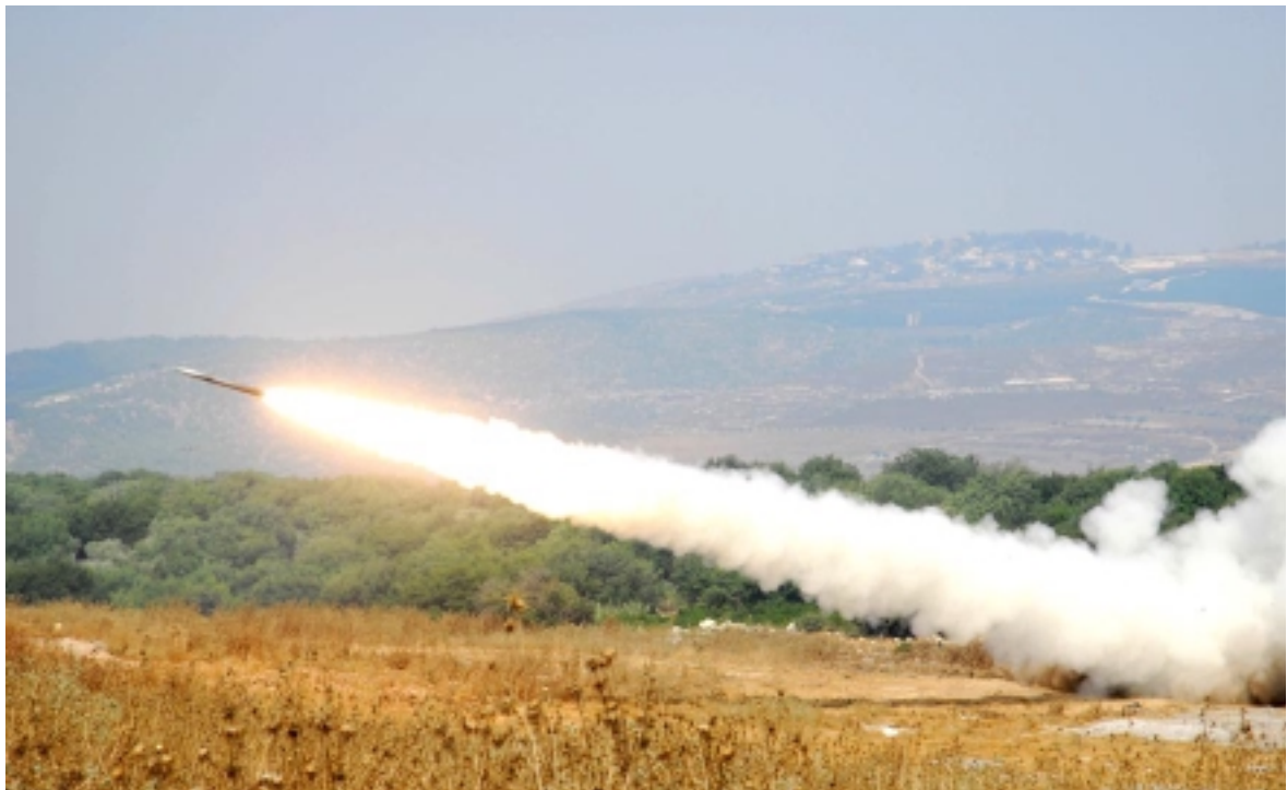
«Wir müssen unser Abschreckungspotenzial wieder herstellen.»

Einige von uns haben uns schon lange gewarnt und vorausgesehen, dass der einseitige Rückzug aus dem Libanon und aus Gaza zur Schaffung iranischer Stützpunkte vor den Toren Israels führen würde. Uns war auch bekannt, dass Iran Atomwaffen baut, um Israel zu vernichten. Doch bis zu dem Zeitpunkt, da der iranische Präsident Mahmud Ahadinejad, der neue Hitler unserer Zeit, in der Lage ist, von dort aus anzugreifen, führt er seinen Krieg gegen Israel über die Zwischenstationen Hisbollah und Hamas. Dies ist die wesentliche Information, die dank diesem Krieg der ganzen Welt, oder zumindest jenen, die es sehen wollen, vor Augen geführt wurde. In Israel selbst besteht kein Zweifel mehr daran, und ein präziser Vorgehensplan in fünf Schritten drängt sich auf.